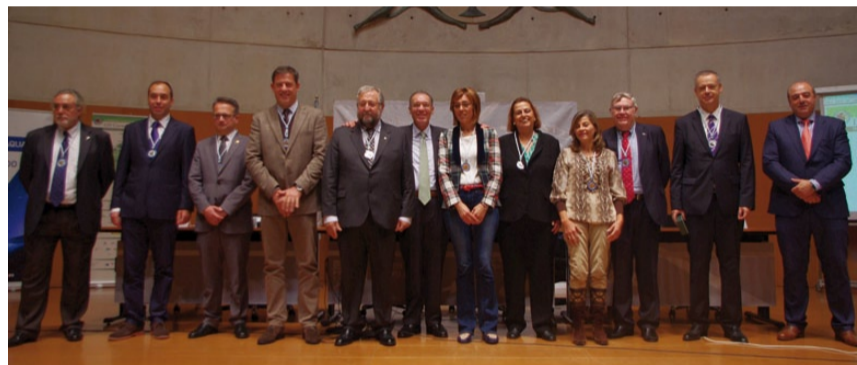
FOTO DE FAMILIA de algunos de los premiados en el curso de medioambiente