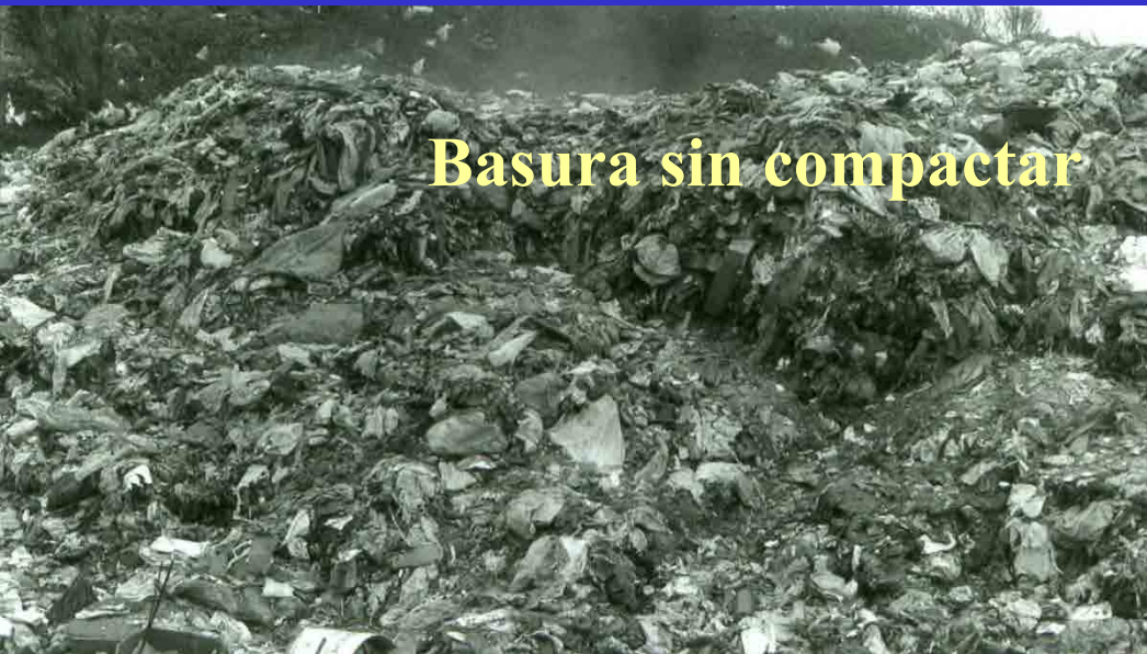
Basura sin compactar