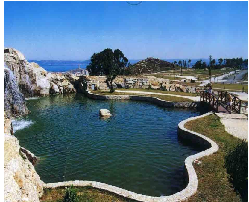
Parque de Bens