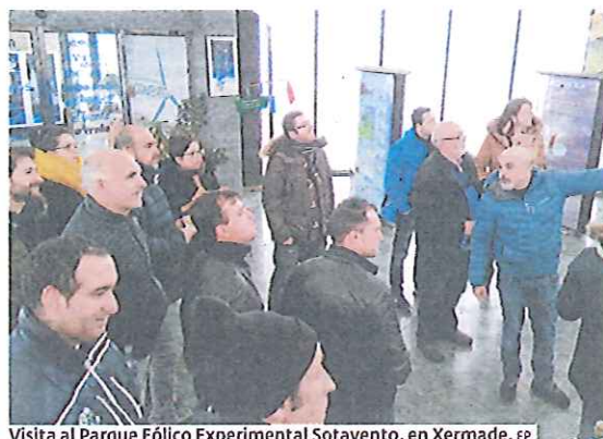
Visita al Parque Eólico Experimental Sotavento, en Xermade.

El director de este seminario destacó además la buena receptividad ante esta convocatoria, que sumó más de un centenar