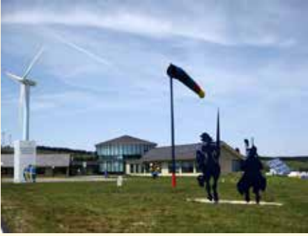
Parque eólico experimental Sotavento