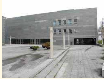
Auditorio municipal "Carmen Estévez" de Vilalba