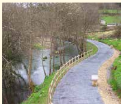
Paseo fluvial da Madalena en Vilalba