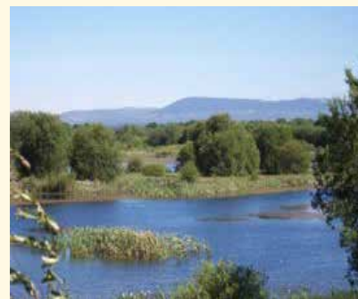
Lagoa de Cospeito