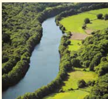
Reserva da Biosfera Terras do Miño